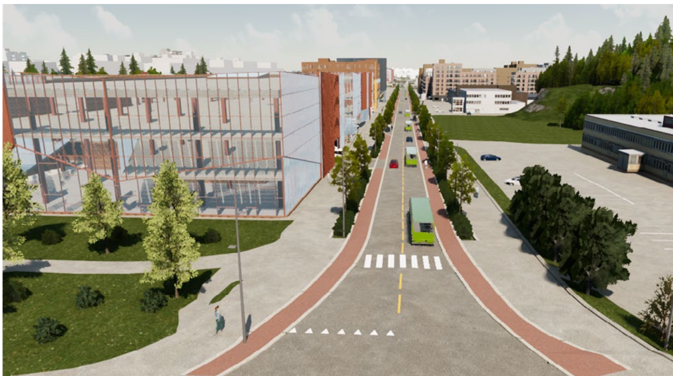
Lørenskogs nye sentrumsgate, Skårersletta, skal bli en hyggelig sentrumsgate med folkeliv, aktivitet og trivelige møteplasser. Skårersletta finansieres med grønt lån fra KBN. Illustrasjon: Norconsult/Baezeni.

KBN er 100 prosent eid av staten Norge. Vårt formål er å gi lån til kommuner, fylkeskommuner og selskaper som utfører kommunale oppgaver. KBN ble etablert i 1927 og er i dag den største långiveren til kommunesektoren. Totalt har vi over 300 milliarder kroner utestående i lån til sektoren.