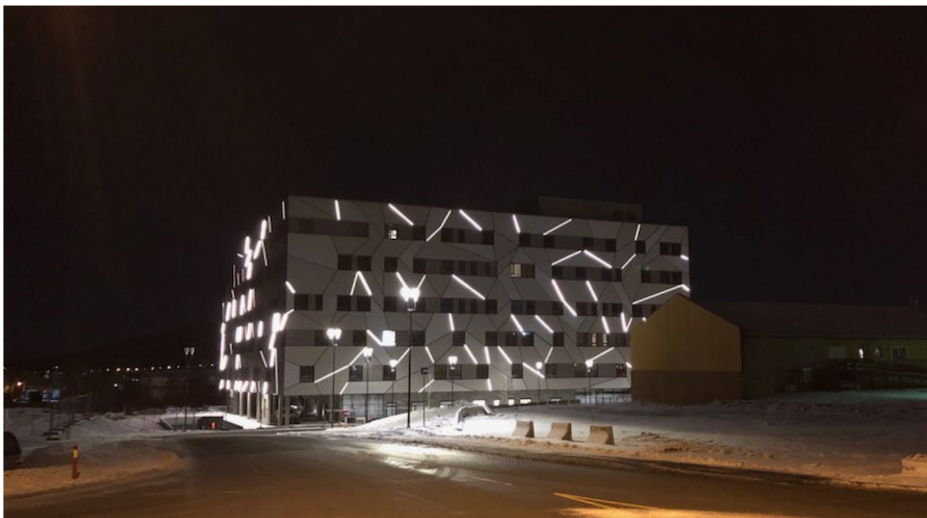
Region Nordhordland Helsehus bygges for å samlokalisere helsetjenester for innbyggerne. Helsehuset bygges som et passivhus, og skal varmes opp ved hjelp av varmepumpe, som dekker 85% av det årlige varmebehovet. Bygget finansieres med grønt lån fra KBN.

KBN er 100 prosent eid av staten Norge. Vårt formål er å gi lån til kommuner, fylkeskommuner og selskaper som utfører kommunale oppgaver. KBN ble etablert i 1927 og er i dag den største långiveren til kommunesektoren. Totalt har vi over 300 milliarder kroner utestående i lån til sektoren.